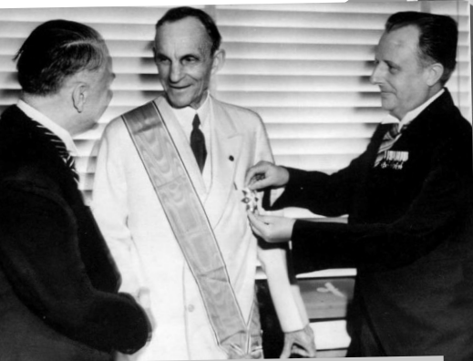
Γερμανοί διπλωμάτες απονέμουν στον Henry Ford, στο κέντρο, το υψηλότερο παράσημο της Ναζιστικής Γερμανίας για τους αλλοδαπούς, το Μεγάλο Σταυρό του Γερμανικού Αετού, Νοεμβρίου 1938

Γι’ αυτόν το σκοπό αποφασίστηκε η συγκρότηση ειδικού ταμείου, το οποίο οι παρευρισκόμενοι «προικοδότησαν» με το ιλιγγιώδες τότε ποσό των 3.000.000 μάρκων. Μαζί με αυτούς οικονομική ενίσχυση απλόχερα έδωσαν στον φασισμό δεκάδες καπιταλιστές των Ηνωμένων Πολιτειών, της Αγγλίας και της Γαλλίας (“Ford”, “General Motors”, IBM κ.α.)