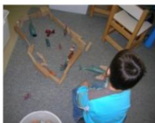
Γωνιά του κουκλόσπιτου 2τ.μ.