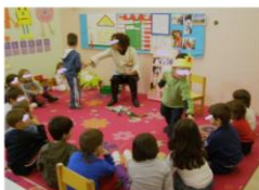
Γωνιά του Η.Υ. 2,58τ.μ.